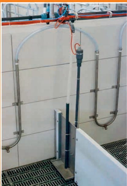
Anschluss an automatisches Rohrleitungssystem für das Futter und für die Reinigung der Tröge.

Die Prefeed Saugferkelfütterung ist im Prinzip eine Flüssigfütterung für minimale Mengen. Dadurch kann gewährleistet werden, dass das Futter stets frisch von den Saugferkeln verzehrt werden kann. So lassen sich die ersten Lebenstage der Ferkel deutlich optimieren.