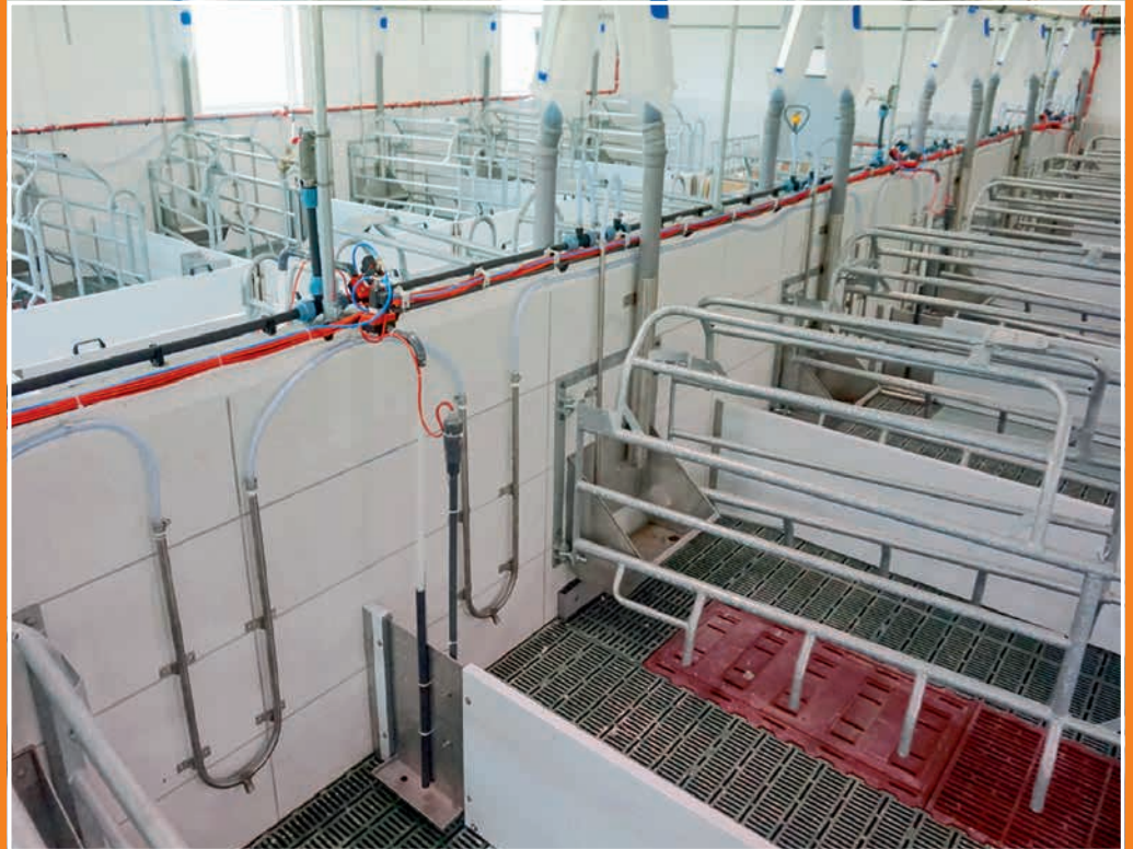
Die kleinen Ferkeltröge sind jeweils von zwei Buchten zugänglich. Sie können entweder rund oder eckig geliefert werden.

Für mittlere und größere Ferkelerzeuger ab 250 Sauen ist die Prefeed Fütterung eine deutliche Arbeitserleichterung. Denn vor allem die Betreuung der Saugferkel während und nach der Geburt ist entscheidend für positive Kennzahlen im Betrieb. Die Prefeed Saugferkelfütterung ergänzt die Versorgung in den ersten Lebensstagen optimal, so dass das Schwein einen guten Start hat und in einer guten Verfassung auf die Mast vorbereitet ist.