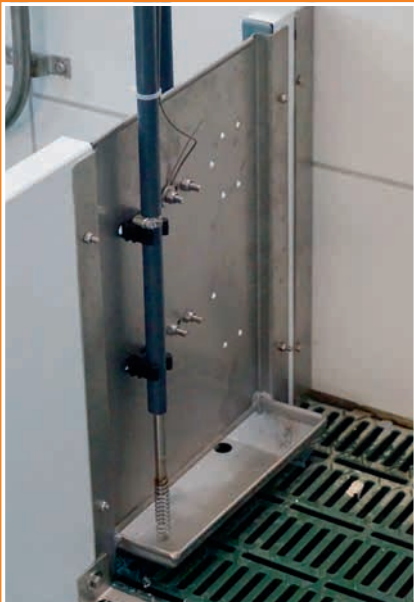
Der Trog ist elegant in der Trennwand der Abferkelbucht untergebracht.

Die Prefeed Saugferkelfütterung von T.E.L.L. ermöglicht einfach und effizient ein vollautomatisches Zufüttern der Saugferkel in der Abferkelbucht ab dem Tag der Geburt. In kleinsten Mengen - ca. 130 g Futter pro Dosiervorgang - wird das Prestarter Futter immer wieder frisch in den Trog ausdosiert. Dies führt u.a. zu folgenden positiven Ergebnissen: