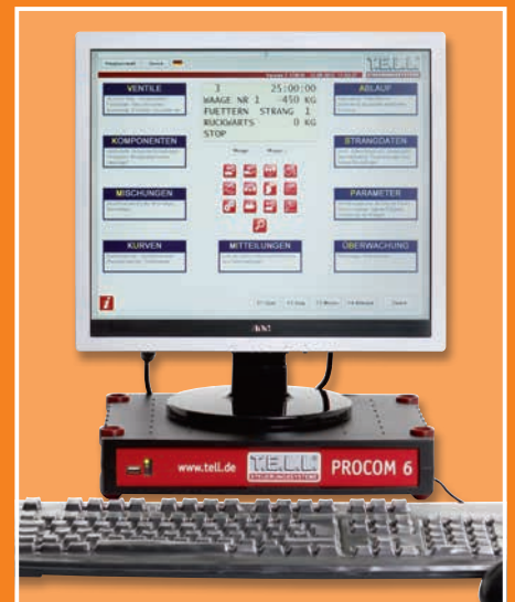
Ansteuerung mit dem bewährten PROCOM