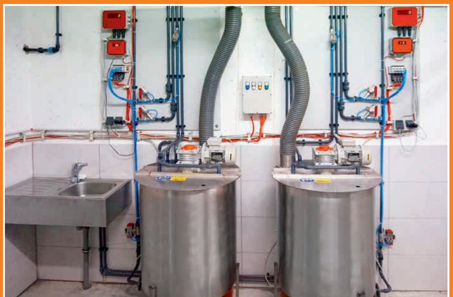
Zwei Anmischbehälter ermöglichen unterschiedliche Futter-Rezepturen, je nach Lebensalter der Ferkel. So kann beispielsweise in der ersten Lebenswoche anderes gefüttert werden als in der vierten.